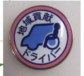
バッジB ピンバッジ